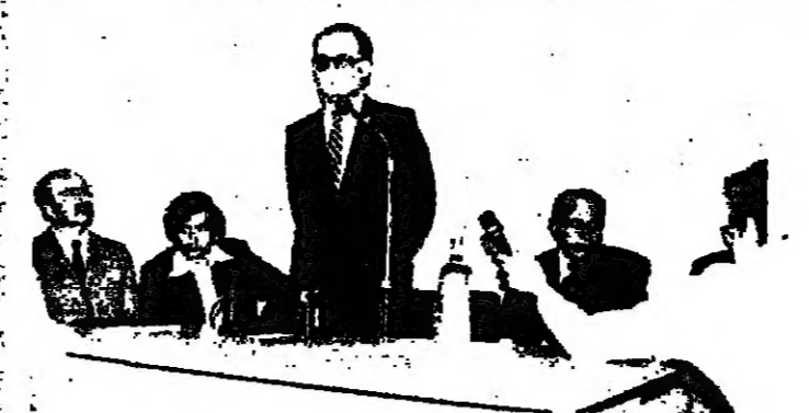
رئيس الحكومة محاضرا في كلية الحقوق